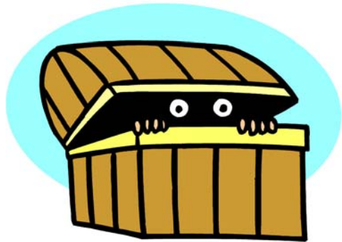
Some of the clip art used on this flyer was provided by JupiterImages © 2007 Jupiterimages Corporation